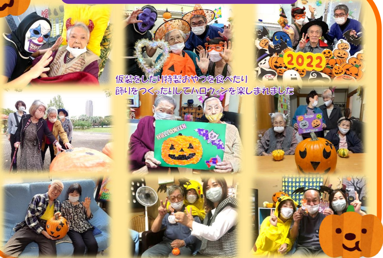
仮装をしたり特製おやつを食べたい 飾りをつくったりしてハロウィンを楽しみました