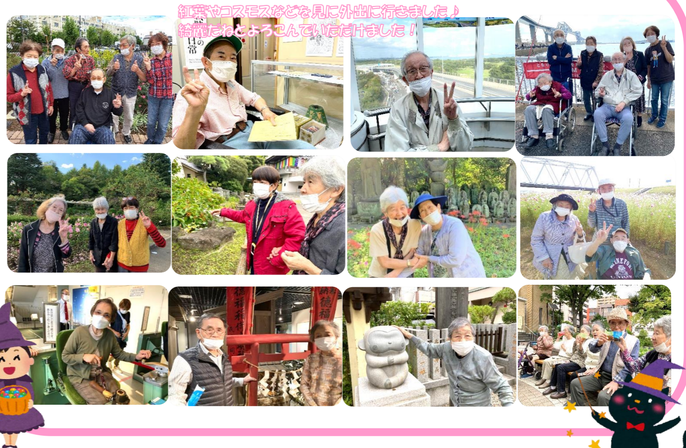
紅葉やコスモスなどを見に外出に行きました♪ 綺麗だねとよろこんでいただけました！